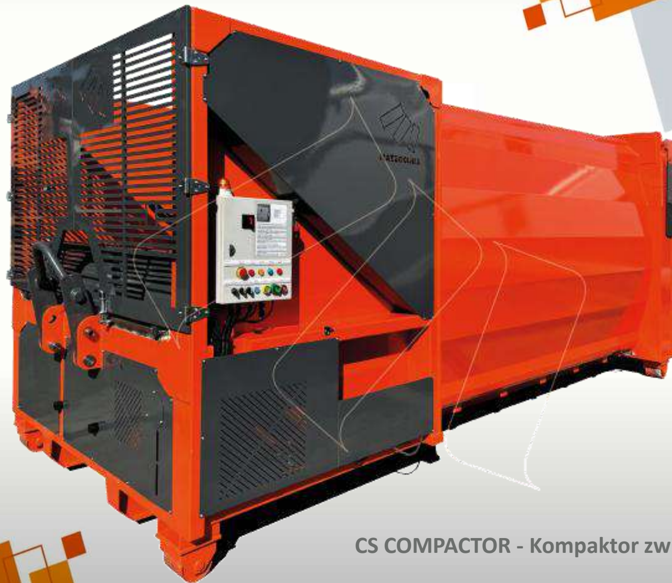
CS COMPACTOR - Kompaktor zwijający i przechylający