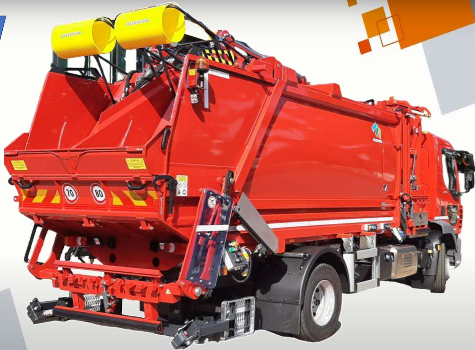
WYPOSAŻENIE TRINOS: Rozwiązanie z trzema przedziałami